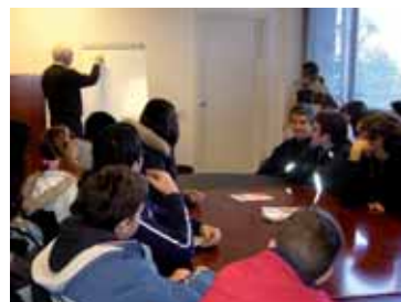
Alumnos de F. P. Oscus de visita en el Banc dels Aliments.