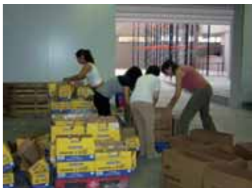
Un grupo del Centre d'Educació Especial Municipal La Ginesta llevando a cabo tareas de voluntariado en el almacén del Banc.