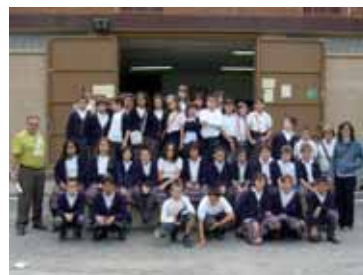
Un grupo de alumnos de la Escuela Camí durante la visita al Banc.