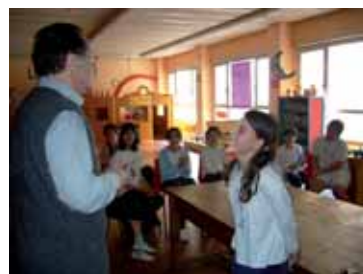
Alumnos del CEIPM Reina Violant hacen entrega a un voluntario del Banc del trabajo informático sobre el Banc dels Aliments.