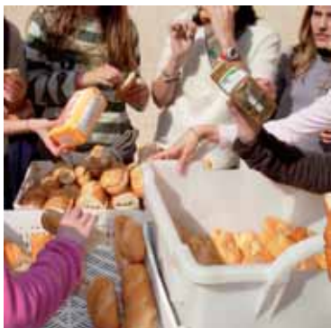
Intercambio del bocadillo solidario por paquetes de alimentos en la Escola Suïssa.