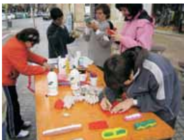
Mercado de Intercambio organizado por Esplai la Llar del Vent. Cambian manualidades elaboradas a partir de materiales de desecho por alimentos.