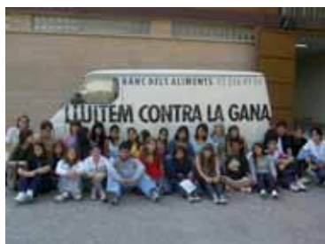
Visita de los alumnos de la escuela Vedruna Àngels al Banc dels Aliments.