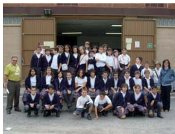
Un grup d'alumnes de l'Escola Camí durant la seva visita al Banc.

48.000 alumnes participants en la campanya