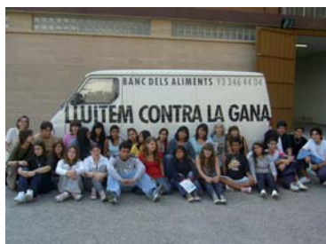
Visita dels alumnes de l'escola Vedruna Àngels al Banc dels Aliments.

Com cada any per celebrar l'esdeveniment mundial del 16 d'octubre, Dia Mundial de l'Alimentació, organitzem la campanya "FEM-HO POSSIBLE TOT L'ANY", amb l'objectiu de facilitar la reflexió i conscienciació sobre d'un dels drets humans més vitals de les persones, el dret a l'alimentació, i sobre la pobresa que hi ha a prop de casa a més de conèixer la lluita que realitza el Banc dels aliments contra el malbaratament, tot suscitant l'esperit solidari dels estudiants i potenciant el creixement en valors a l'escola.