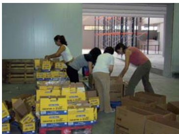
Un grup del Centre d'Educació Espacial Municipal La Ginesta realitzant tasques de voluntariat al magatzem del Banc.