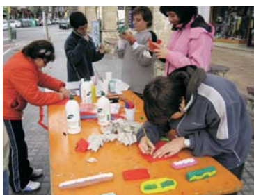
Mercat d'Intercanvi que organitza l'Esplai la Llar del Vent. Canvien manualitats fetes a partir de material de rebuig per aliments.