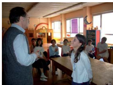
Alumnes del CEIPM Reina Violant fent l'entrega a un voluntari del Banc del treball informàtic sobre el Banc dels Aliments.