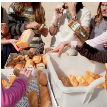
Intercanvi de l'entrepà solidari per paquets d'aliments a l'Escola Suïssa.