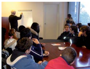
Alumnes de F. P. Oscus de visita al Banc dels Aliments.